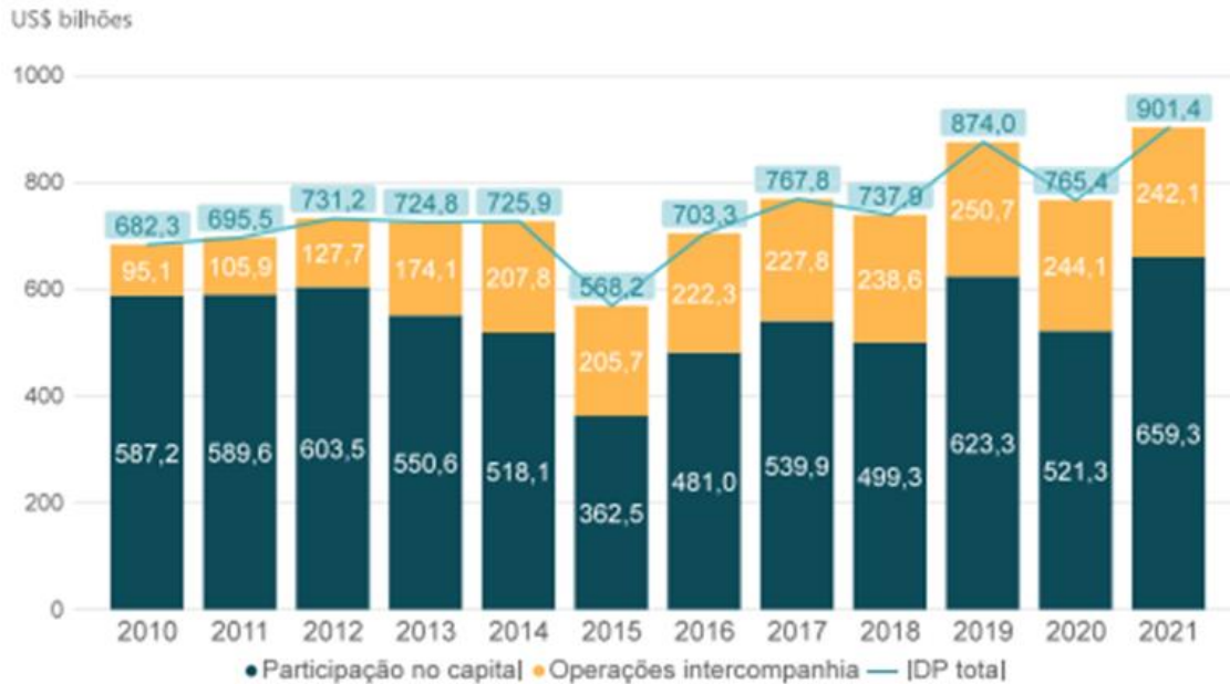
Figür 2 – Gelen FDI Stoku (Milyar $)

Brezilya Merkez Bankası verilerine göre bölge olarak Avrupa, 2021 yılı itibariyle yapılan toplam doğrudan yabancı yatırımların %62,9'unu gerçekleştirmiştir (Figür 3). Bu bölge kapsamında en çok yatırımı bulunan ülkeler sırasıyla Hollanda (%40,5), Lüksemburg (%16,7) ve İspanya (%11,1) olmuştur. Kuzey Amerika bölgesi ise 200,5 milyar ABD Doları ile ülkedeki doğrudan yabancı yatırımların %22,2'sini oluşturmuştur. Bu bölge kapsamında en çok yatırımı bulunan ülke ABD (%8,3) olmuştur (Figür 3).