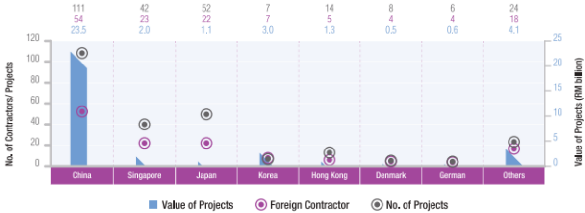
Figure 2.15 | Projects Awarded to Foreign Contractors by Country