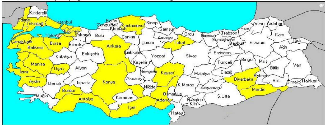
Şekil 3. Zeytinyağı İşletmelerinin Bulunduğu İller