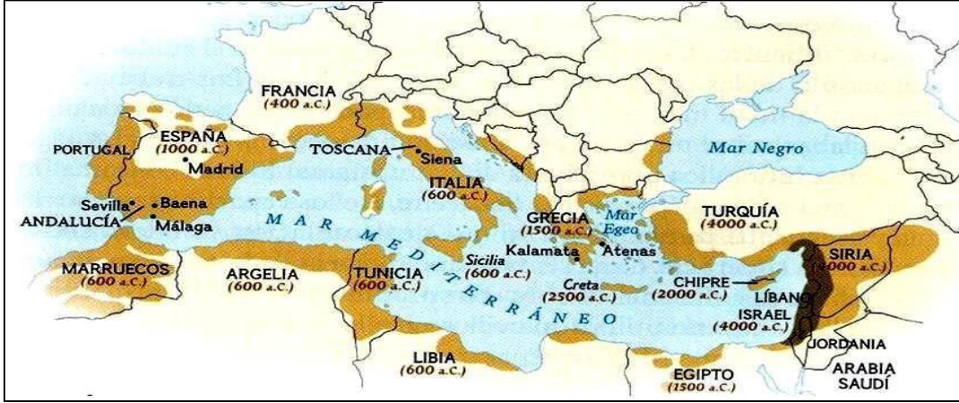
Şekil 1. Zeytin Üretiminin Yayılışı

Kutsal zeytin ağacı; Akdeniz uygarlığının sembolüdür. Tüm dünyada 900 milyon ağaçtan % 98' i Akdeniz çanağında yer almaktadır.